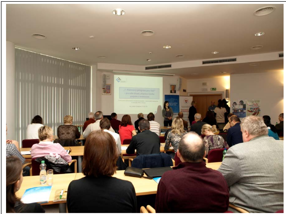
Pohled do přednáškového sálu