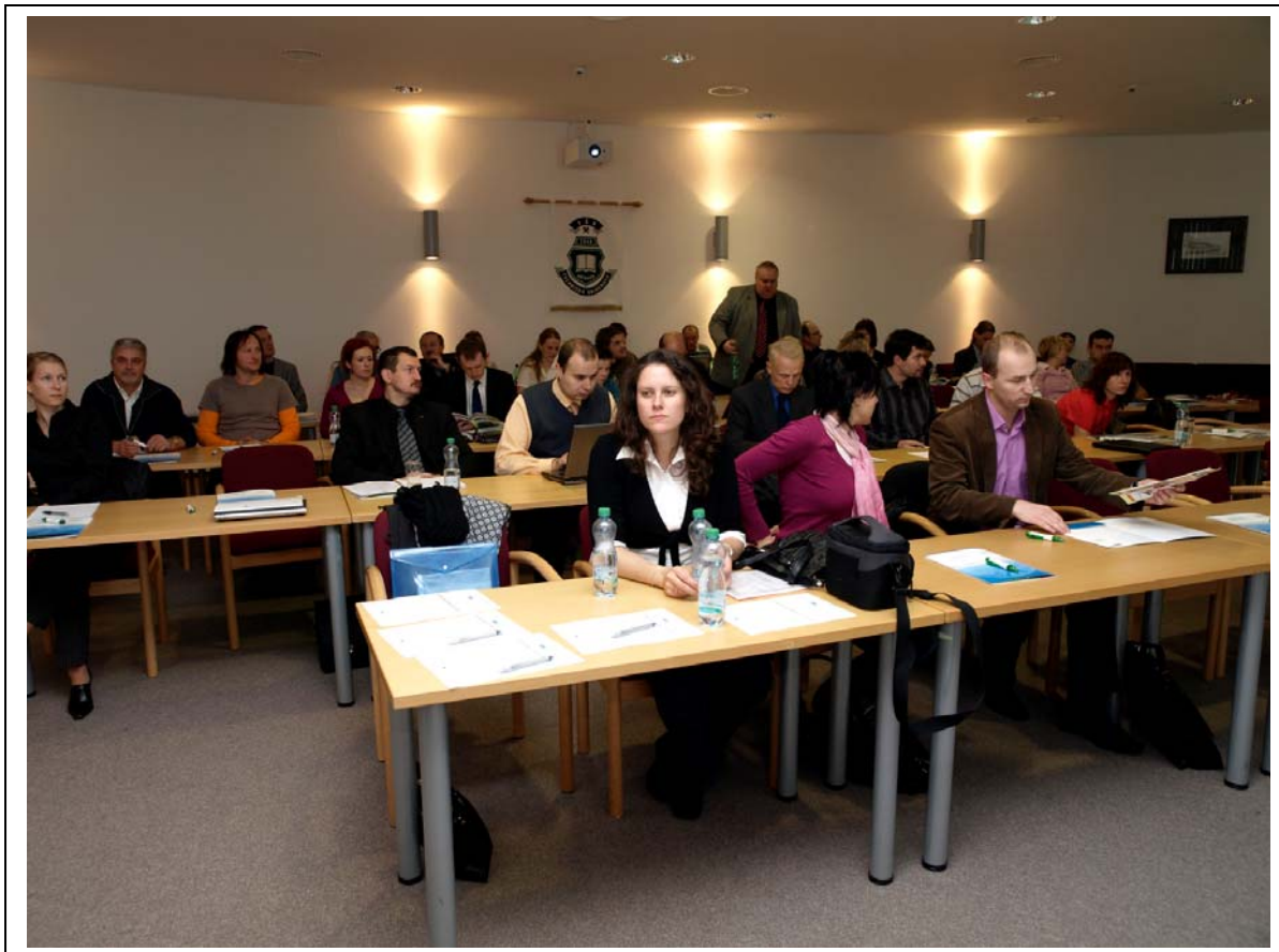
Účastníci před zahájením semináře