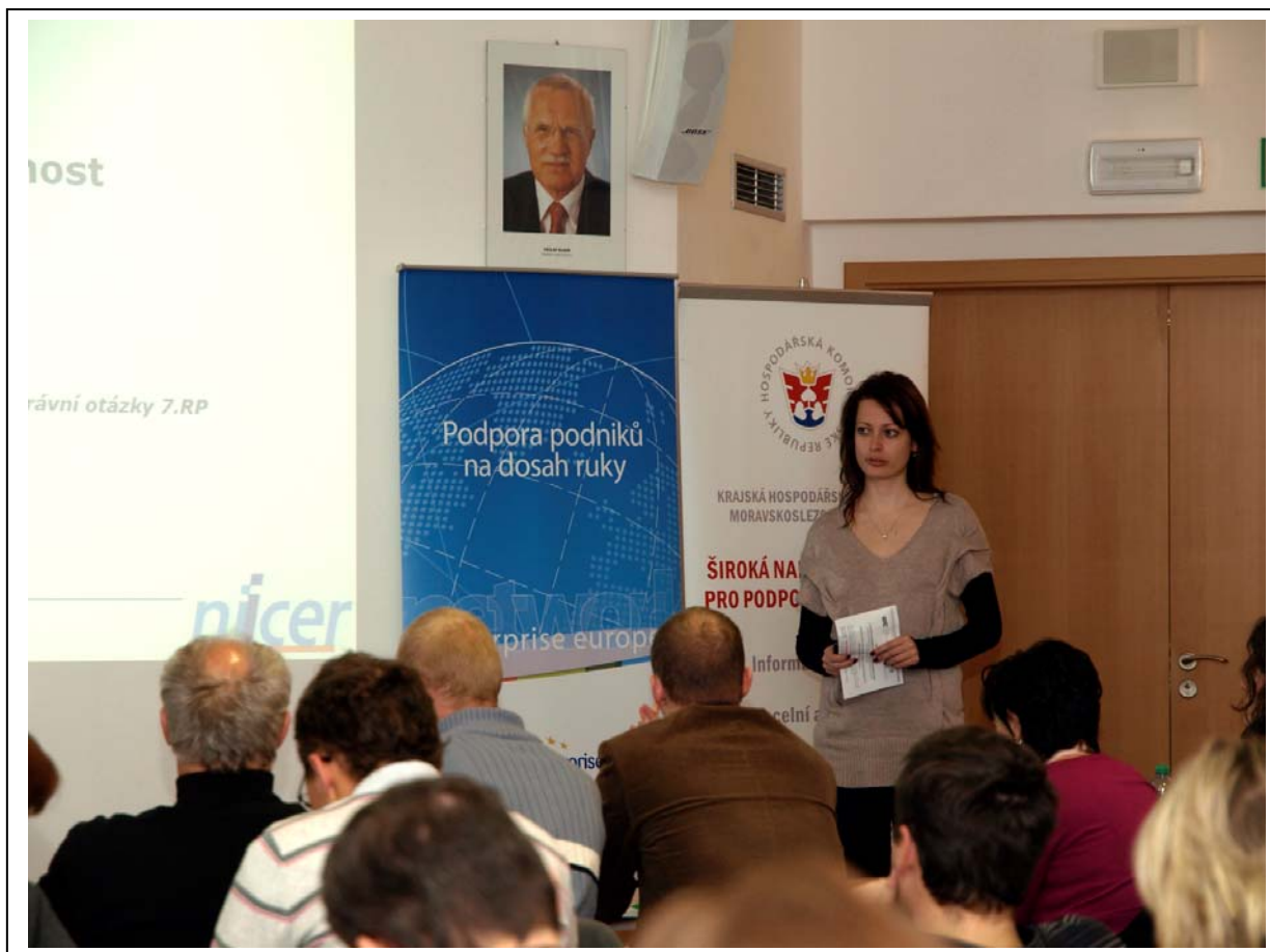
Zástupkyně Krajské hospodářské komory