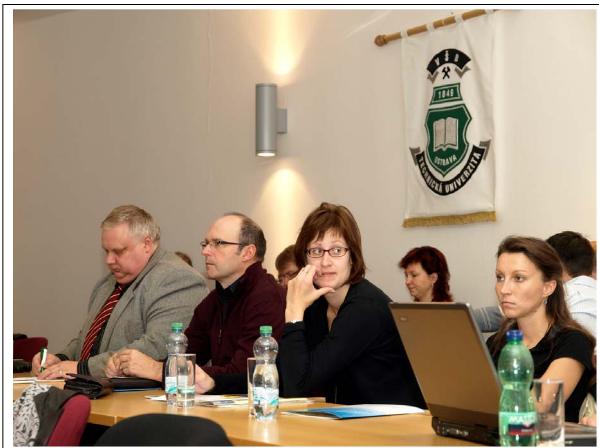
Fotografie z průběhu semináře