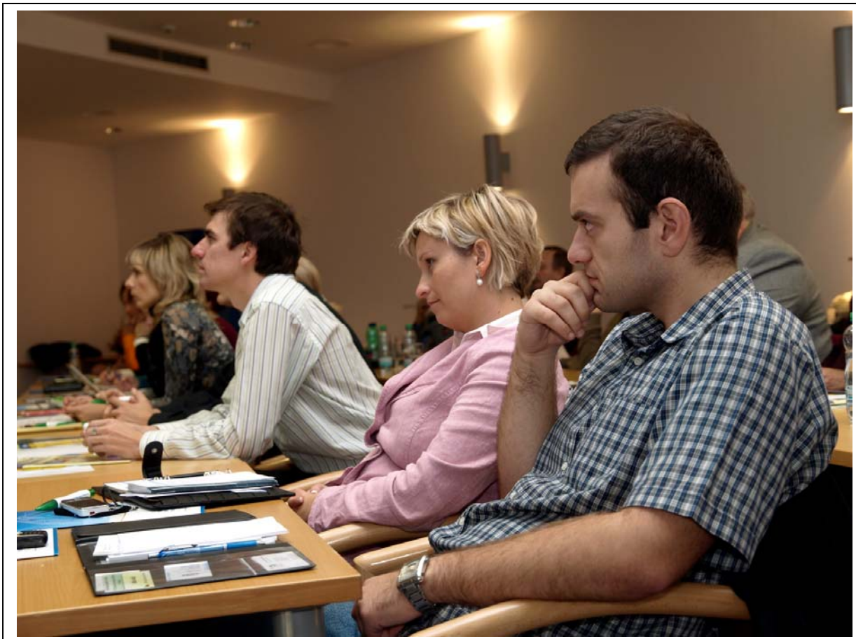
Fotografie z průběhu semináře