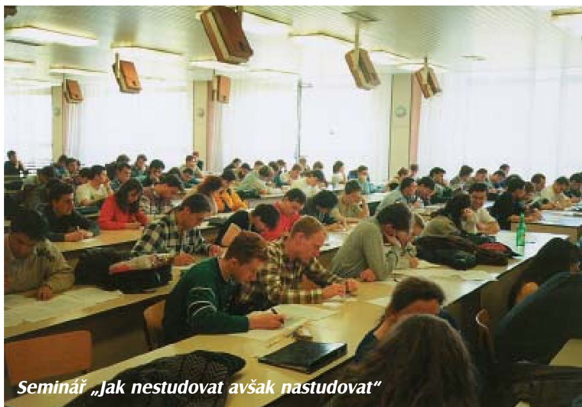
Seminář „Jak nestudovat avšak nastudovat“