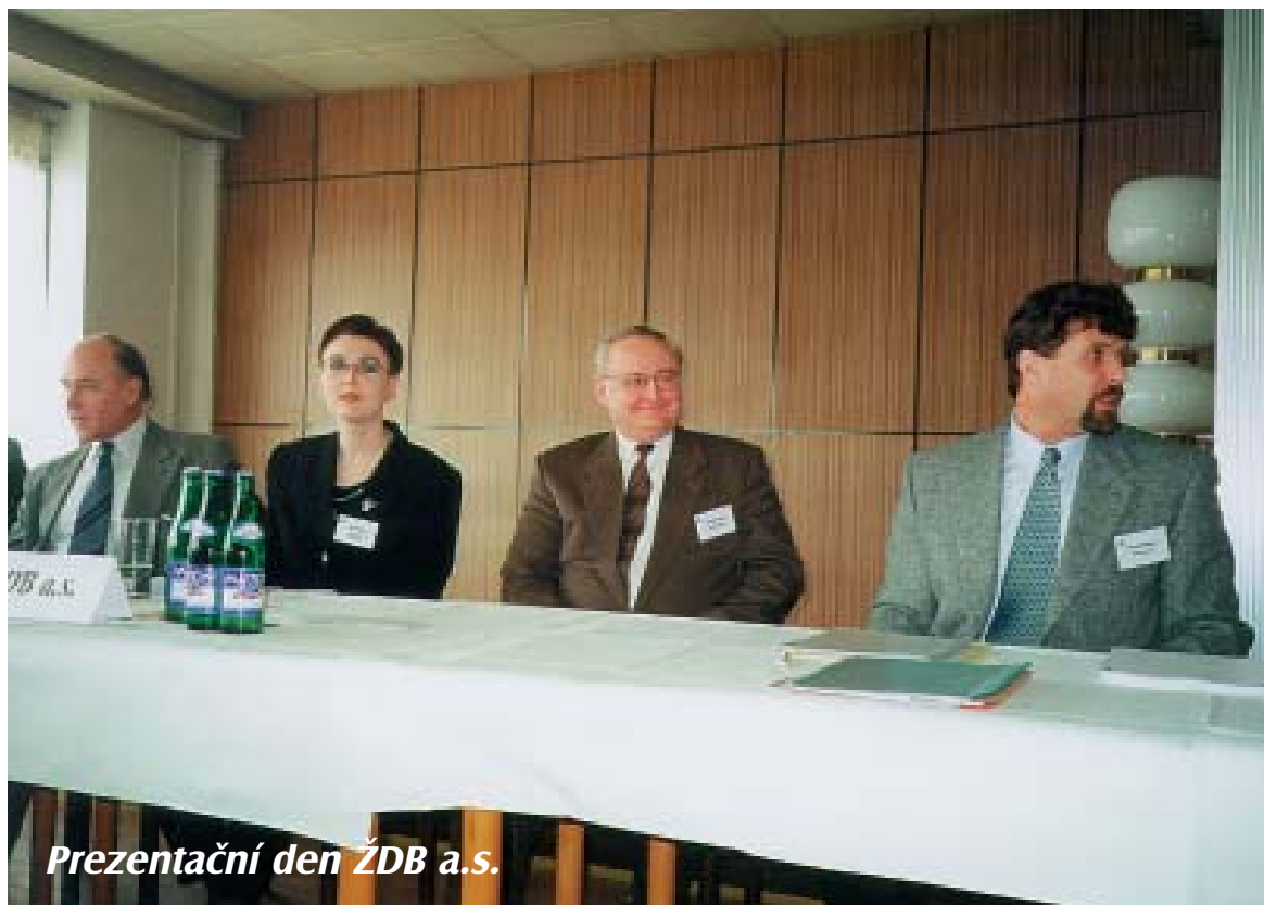
Prezentační den ŽDB a.s.