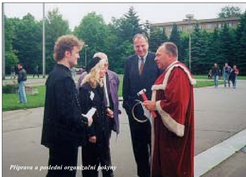
Příprava a poslední organizační pokyny