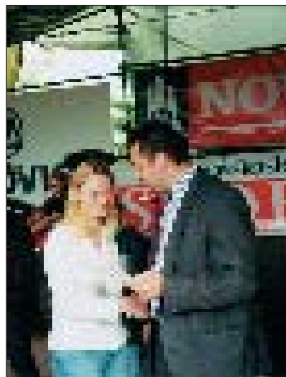
Ředitel KaM předává cenu vítězce soutěže

Další zemí, kterou v budoucnu určitě navštíví, je Anglie, kde má hodně přátel, a zejména Wales se svou nádhernou přírodou. Mezi její oblíbené sporty patří především hokej, aktivně hraje tenis a jezdí na kolečkových bruslích. Tato sympatická modrooká blondýnka se cítí dobře v prostředí, kde je dobrá zábava, chodí