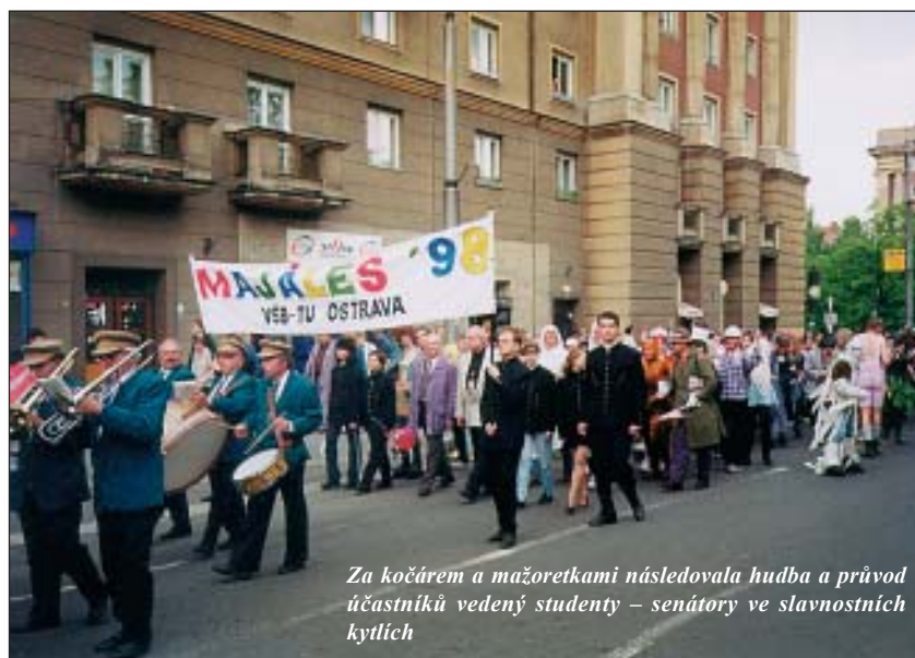
Za kočárem a mažoretkami následovala hudba a průvod účastníků vedený studenty – senátory ve slavnostních kytlicích

Na ty roztomilé panenky jeden z pořadatelů nějak pozapomněl a tak nebyl tím posledním na koho se čekalo koňský povoz, ale 17 malých slečen,