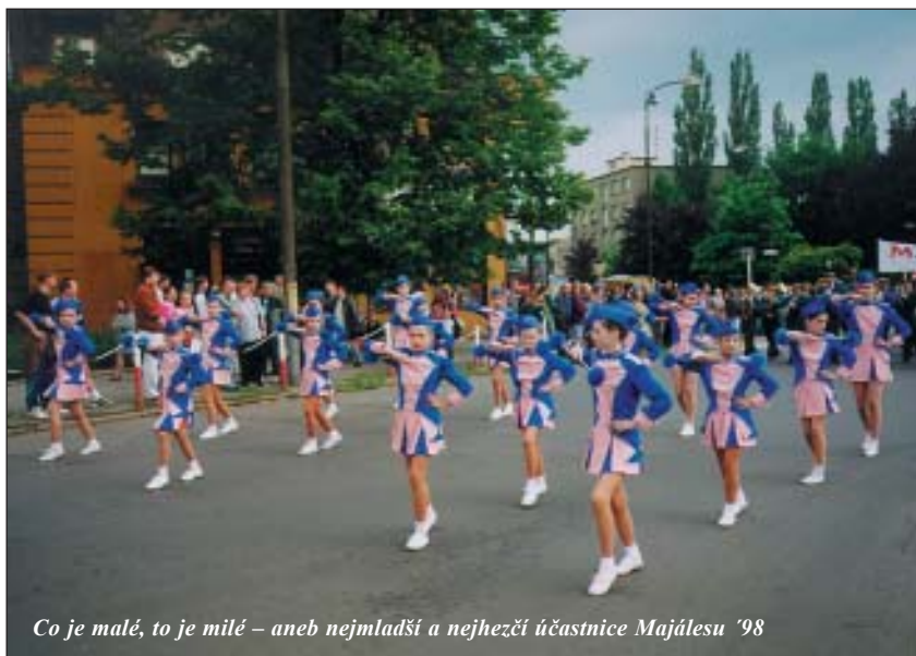
Co je malé, to je milé – aneb nejmladší a nejhezčí účastnice Majálesu '98

kteří byly (jak se později ukázalo) jednou z největších ozdob celého průvodu.