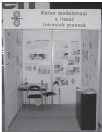
Stánek na METALU

Trať TANDEM teď stojí v porubské laboratoři G-125, holka zlatá, dychtivě rozevívá do šíře 4.6 metrů své válečkové dopravníky, vyzývavě pomrkává barevnými displeji a kontrolkami na řídicím pultu a za temné mručení motorů se tetelí očekáváním na každou další horkou a těžkou válcovačku. Dvě těsně vedle sebe umístěné reverzní