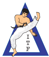
škola IL DONG

Když v dubnu roku 1955 bylo v Koreji generálem CHOI HONG HI poprvé oficiálně představeno veřejnosti bojové umění sebeobrany TAEKWON-DO, nikdo netušil jak populární se za několik málo let stane. Dnes, 43 let po jeho vzniku, jej aktivně vyznává přes 60 miliónů lidí na celém světě a ve své sportovní podobě (W.T.F.) bylo dokonce zařazeno do rodiny olympijských sportů.