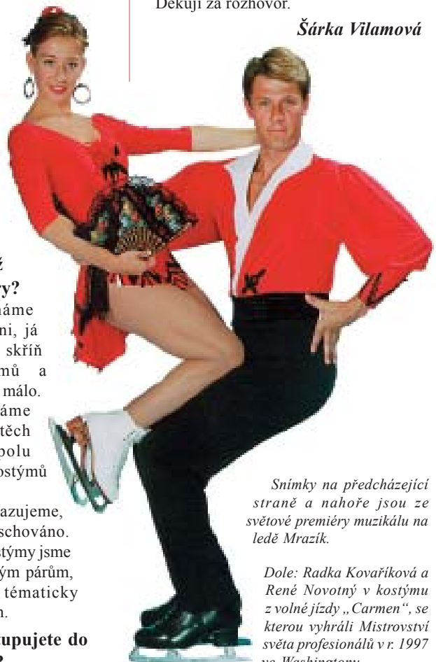
Snímky na předcházející straně a nahoře jsou ze světové premiéry muzikálu na ledě Mrazík.