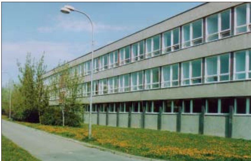
Budova Fakulty stavební VŠB-TUO na ulici L. Poděštil

předseda koordinačního výboru evaluace na VŠB-TUO