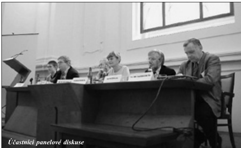
Účastníci panelové diskuse