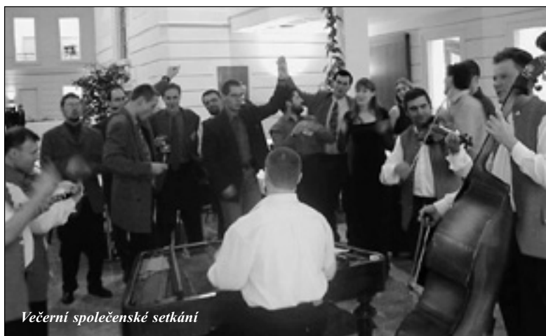
Večerní společenské setkání