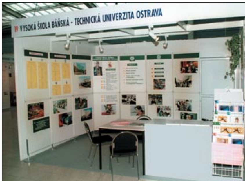
Záběr prezentačního stánku VŠB–TUO na veletrhu Gaudeamus 2001

Další prezentační akcí, které se naše univerzita zúčastnila, je výstava „Učeň, středoškolák, vysokoškolák“, která probíhá vždy začátkem prosince na výstavišti Černá louka v Ostravě. Přesto, že tato akce je zaměřena spíše na oblast středních škol na-