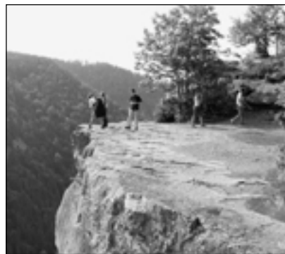
Tomovšovský výhled na Prielom Hornádu

Text a foto: Ing. Vlastimil Řepka, Ph.D. Institút hornického inženýrství a bezpečnosti HGF