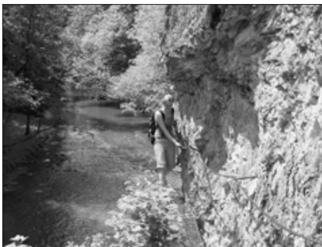
Prielom Hornádu – stupačky