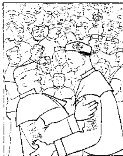
Sjezd bývalých posluchačů VŠB v Příbrami září '03