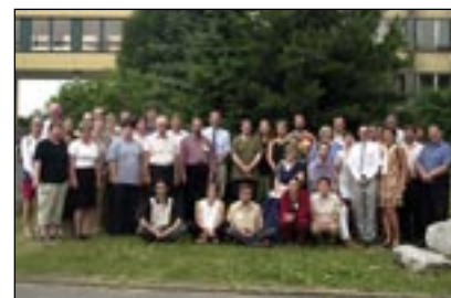
Dokumentární fotografie všech účastníků semináře

sené příspěvky tématicky pokrývaly značný časový rozsah geologické minulosti Země od kambria až do kvartéru včetně. Obdobně tomu bylo z hlediska zastoupení jednotlivých odvětví paleontologie, když byly prezentovány příspěvky z fytopaleontologie, zoopaleontologie bezobratlých i obratlovců, a to jak ve sféře mikropaleontologie, tak makropaleontologie, stejně jako byly dokumentovány nové směry v metodice výzkumu.