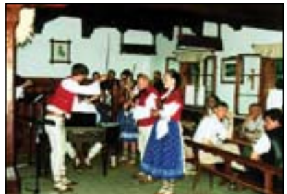
Účastníci konference ve skanzenu v Rožnově pod Radhoštěm v Hospodě na posledním groši

Konference měla bohatý společenský doprovodný program, který uvítali zejména zahraniční účastníci. Velký ohlas měl tradiční Skok přes kůži, zejména pro 3 Japonce. Velice úspěšný byl i sobotní výjezd mimo Ostravu. Účast-