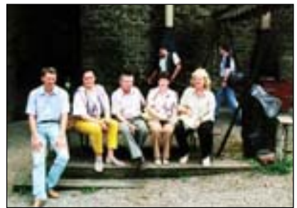
Účastníci konference z Ruska na hradě Helfštýn

vydán rozsáhlý dvoudílný sborník, který obsahuje 123 referátů v plném znění. Ve sborníku jsou uvedeny i referáty, které na konferenci nezazněly.