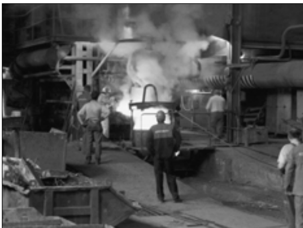
Odpich mědi v Kovohutích Krompachy

Ve dnech 2.–6. 6. 2003 se uskutečnila v rámci studijního plánu odborná exkurze studentů 4. ročníku oboru Úpravnictví, tentokrát na Slovensko. Odborná exkurze ve výrobních podnicích byla proložena návštěvou přírodních a kulturních památek v oblasti. Studenti měli možnost mezi jiným vidět výrobu měděného drátu od vstupu měděného šrotu do šachtové pece, přes odpich mědi a přelití do konvertoru k rafinaci v Kovohutích Krompachy.