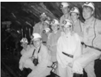
Důl Handlová 280 m pod zemí

Zajímavá byla prohlídka výroby žáruvzdorné suroviny z magnezitu MgCO_3 – jehož třetí největší ložisko na světě je právě v Jelšavě, kterou jsme navštívili. Vytěžená surovina se zde upravuje v těžké suspenzi z ferosilicia a magnetitu a dále se zušlechťuje ve třech rotačních troubových a dvou šachtových pecích. Zde vzniká žáruvzdorný slínek, který se prodává jako polotovár na výrobu žáruvzdorných cihel a malt, např. do pecí v metalurgických procesech.