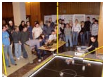
Urupné boje mezi týmy TU Košice a VŠB-TUO Ostrava ve Fotbale robotů