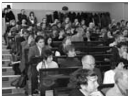
Publikum na přednáškách

Prezentující měli klasicky dvě možnosti, jak představit svůj projekt, buďto v podobě posteru, nebo prezentace. Prezentovalo se po oba dny ve čtyřech přednášecích posluchárnách. Posterům byla vyhrazena hodina a půl ve čtvrtek odpoledne (od 16:30 do 18:00 v Biologickém centru). Na konferenci se představilo více než dvě