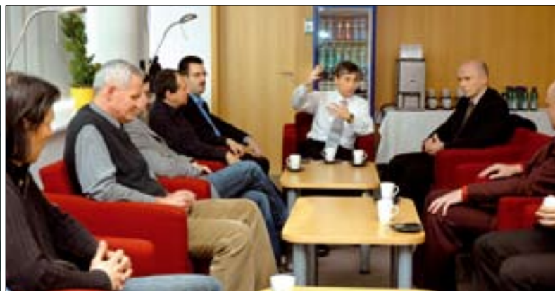
Diskuze mezi zástupci Katedry informatiky FEI VŠB-TUO a vedoucími pracovníky zúčastněných firem na téma společných projektů