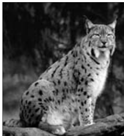
Rys ostrovid ve volné přírodě