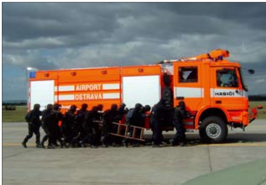
Příchod zásahové jednotky k letadlu