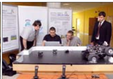
Demonstrace projektu Fotbalu robotů „Miro Sot Junior“