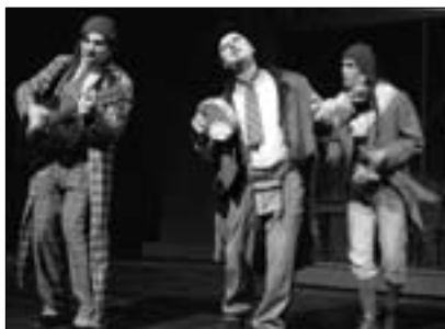
VEČER TŘÍKRÁLOVÝ – sváteční komedie plná milostných vzplanutí, zlomených srdcí a pomíjivosti lidského času.