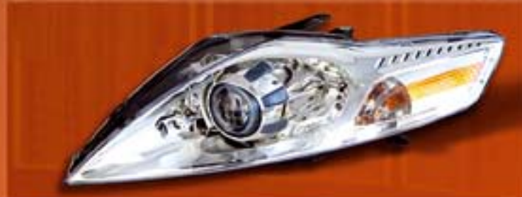
Vývoj světelné techniky